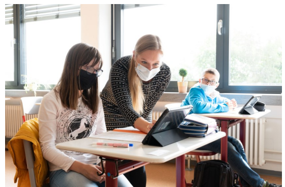
Unterricht an der Bliestalschule

Unter dem Motto: "Auf dem Weg in ein selbstbestimmtes inklusives Leben – Gelungene Konzepte für junge Menschen mit Behinderung in der Berufsfindungsphase", vergibt die Vereinigung der Saarländischen Unternehmensverbände (VSU) in diesem Jahr den Bildungspreis an vier Schulen im Saarland, die ihre Förderkonzepte besonders gut umsetzen. Für den Ausbau dieser Angebote, werden den Schulen jeweils 4.000 Euro von der Stiftung ME Saar zur Verfügung gestellt. Preisträger sind die Bliestalschule in Oberthal, die Galileo-Schule in Bexbach, die Gemeinschaftsschule Saarbrücken-Bruchwiese und die Wingertschule in Neunkirchen. Mehr dazu