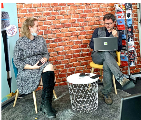
Auf dem Foto:

Das Berufswahl-SIEGEL ist aufgrund der Pandemie und damit zusammenhängender Vorsichtsmaßnahmen des Landes derzeit im „Standby-Modus“. Wir arbeiten gerade mit Hochdruck daran Corona-fähige Konzepte und Strategien für die Weiterführung des Prozesses zu erarbeiten. Im Rahmen eines länderübergreifenden Know-how-Transfers, sind wir im Austausch mit anderen Bundesländern, was Möglichkeiten für virtuelle Audit-Formate und weitere Themen angeht, die Pandemie-bedingt erforderlich sind. Wir halten Sie auf dem Laufenden über aktuelle Neuerungen im Prozess. Nächster Termin für SIEGEL-Schulen ist der 15.12.2020. Hier bieten wir einen virtuellen Workshop mit der Future Skills Initiative an. Mehr dazu.